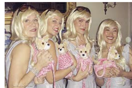
MatchBox har tagit med Paris Hilton till invigningen av jubileumsdagen